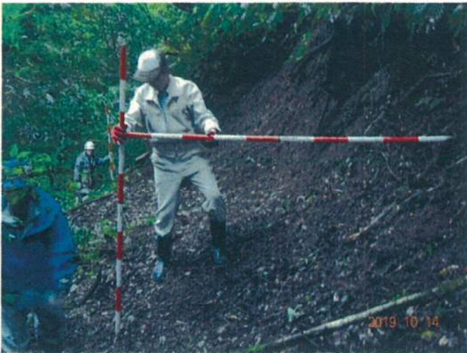
崩壊地上部より上流を見る