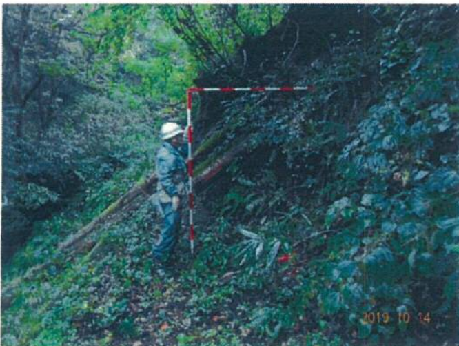
崩壊地下流より上流を見る