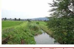
VII-2 (2) 干谷川浚渫 (沖地内)