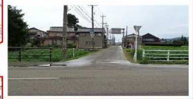
VII-1 (8) 新湊庄川線 (道路計画の策定)