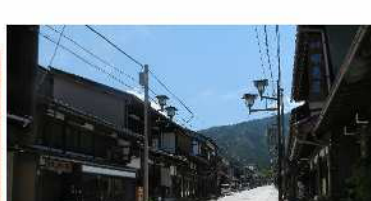
IV-2 八日町通り・本町通り 無電柱化