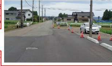
VII-1 (3) 小森谷庄川線 (整備促進)