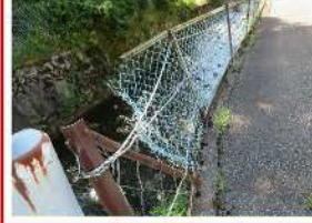
VII-2 (4) 中江川 (転落防止柵補修)