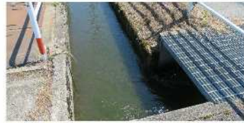
VII-1 (2) 井波福野線、清水明北市 線交差点の横断暗渠水路改修