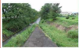
VII-2 (3) 大門川バイパス合流部浚渫