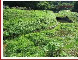
VII-2 (2) 干谷川浚渫 (院瀬見地内)