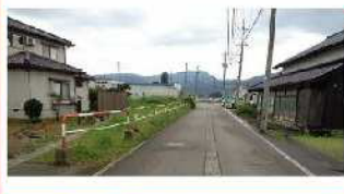
VII-1 (1) 井波福野線 (整備促進)