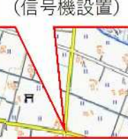
II-1 金沢井波線 信農公民館前 (信号機設置)