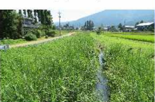
VII-2 (1) 西大谷川浚渫 (沖地内)