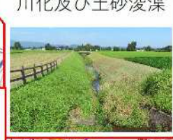
VI-1 勤行寺川の準用河 川化及び土砂浚渫