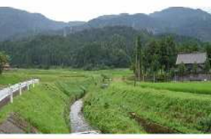
VII-2 (1) 西大谷川浚渫 (清玄寺地内)