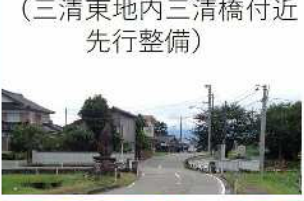
I-1 (2)・VII-1 (6) 金沢井波線 (三清東地内三清橋付近 先行整備)