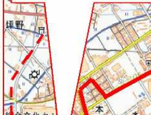
II-1 北陸銀行前交差点 (信号機設置)