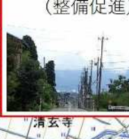
VII-1 (7) 井波城端 線 (整備促進)