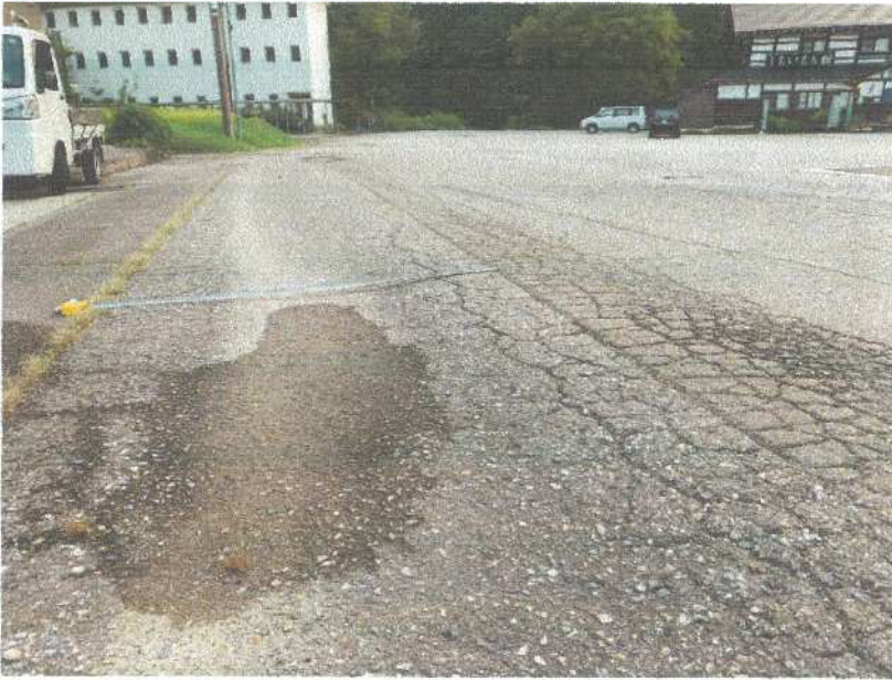
下水道埋設箇所 アスファルト ワダチと ひび割れ状況