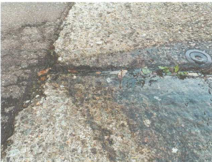
無散水施設 漏水状況