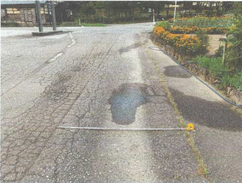
下水道埋設箇所 アスファルト ワダチと ひび割れ状況