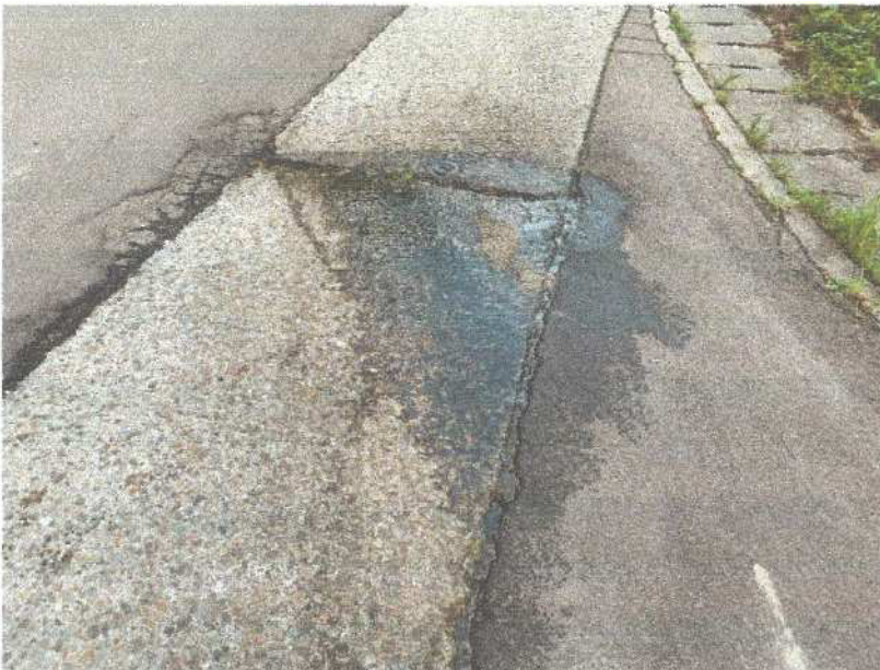
無散水施設 漏水状況