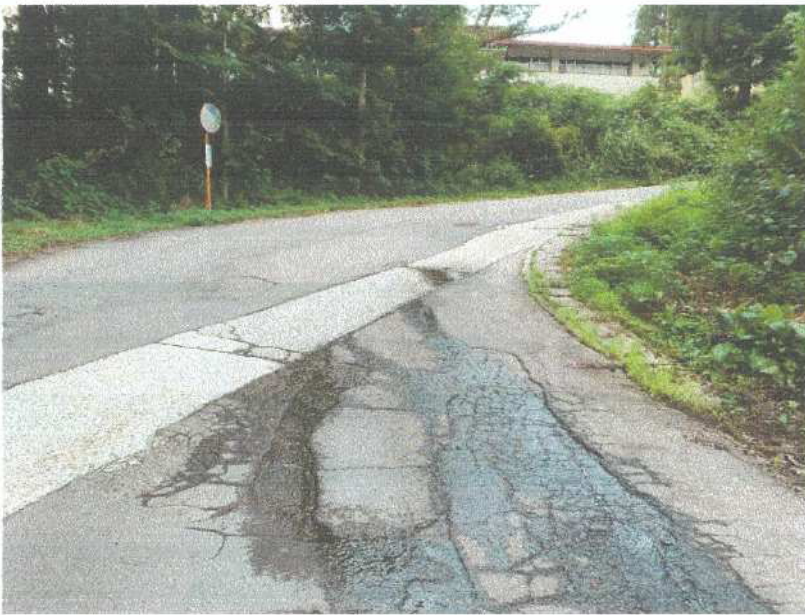
無散水施設 漏水状況