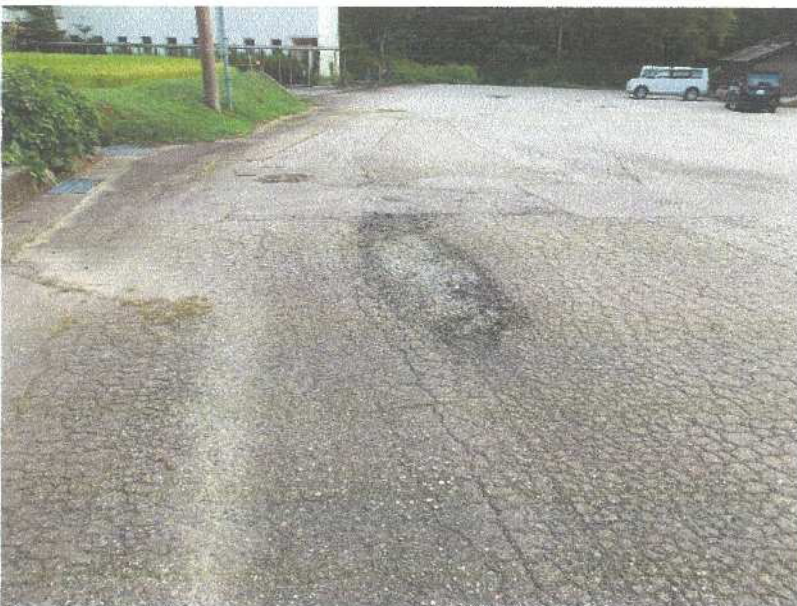
下水道埋設箇所 アスファルト ワダチと ひび割れ状況 舗装の破れ